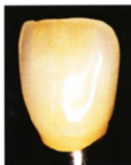
Pieza ya pulida y acabada