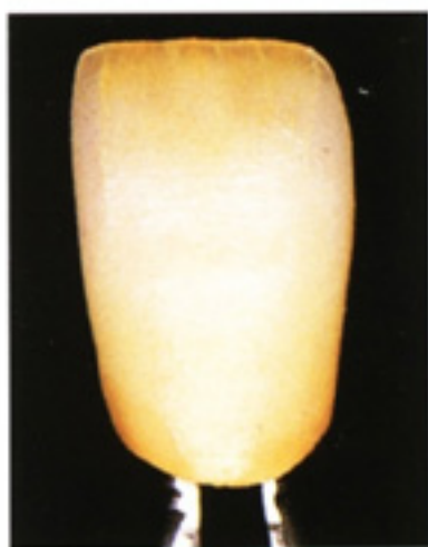
Aplicación del maquillaje interno según el gráfico de coloración